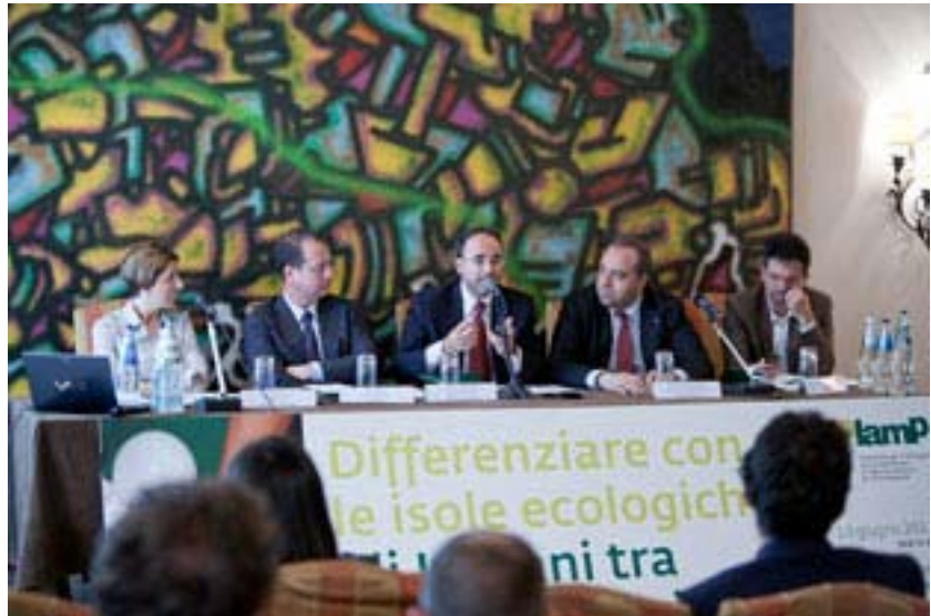
Conferenza Stampa Ecolamp "Differenziare con le isole ecologiche. Gli Italiani tra pensiero e azione". Roma, 10 giugno 2011

Il sondaggio realizzato dall'istituto Nextest rivela che un Italiano su tre utilizza le isole ecologiche, anche per il conferimento dei rifiuti elettrici ed elettronici. In aumento pure la raccolta differenziata delle lampade a basso consumo.