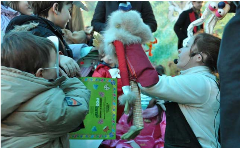
Animazione teatrale, durante il Carnevale di Venezia, 2011 presso il "Bosco della Luce e del Riciclo", stand realizzato da Ecolamp in Campo San Polo (VE)

Luce e del Riciclo", area incantata in cui artisti, attori, giocolieri, fantasisti, acrobati attraverso la fantasia e l'improvvisazione teatrale, il divertimento, giocoleria e acrobazie, teatrini e laboratori interattivi hanno avuto il compito di veicolare il messaggio chiave del Consorzio Ecolamp: le moderne lampadine fluorescenti , che stanno sostituendo le vecchie lampadine a incandescenza, consumano meno, fanno risparmiare energia elettrica, ma quando si esauriscono, non vanno gettate nella pattumiera o nelle campane del vetro.