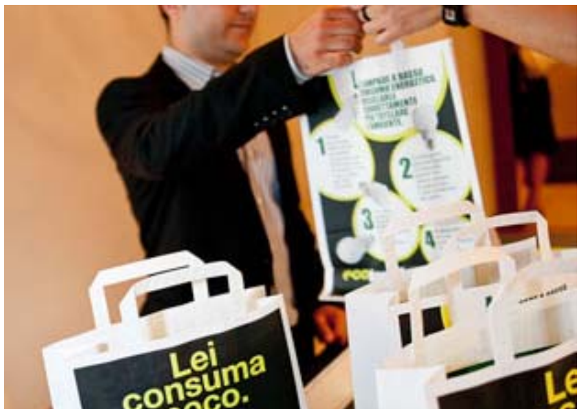
1.000.000 di shopper "Lei consuma poco" con il vademecum sulla raccolta delle lampade a basso consumo esauste distribuite presso le librerie Mondadori.