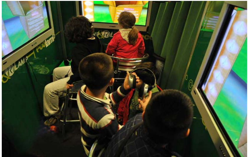
Una scolaresca in visita al tour Lamp&Rilamp.

Si è conclusa in aprile la terza edizione del tour della mostra polisensoriale Lamp&RiLamp, che ha ottenuto il patrocinio dei Ministeri dell'Ambiente e dello Sviluppo Economico, e nel 2011 è passato per Lamezia Terme, Agrigento, Palermo, Cagliari,