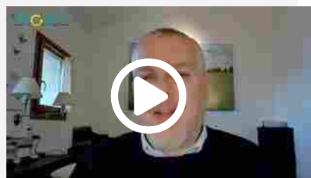
SEO: Core Web Vitals, cosa sono e come farsi trovare pronti