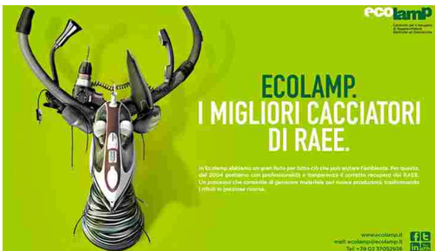
Ecolamp torna in comunicazione con una nuova campagna firmata Eggers

Ecolamp , il consorzio che gestisce il corretto recupero dei RAEE , torna in comunicazione con Eggers.