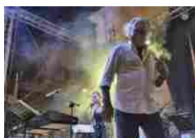
Cotton Club, i concerti del 5 e 6 marzo