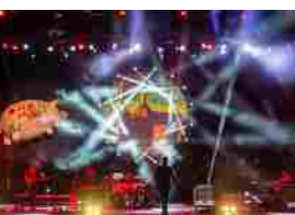
Pink Floyd Legend: sold out per il 14 marzo al Politeama Genovese. Aggiunta nuova data 15 marzo