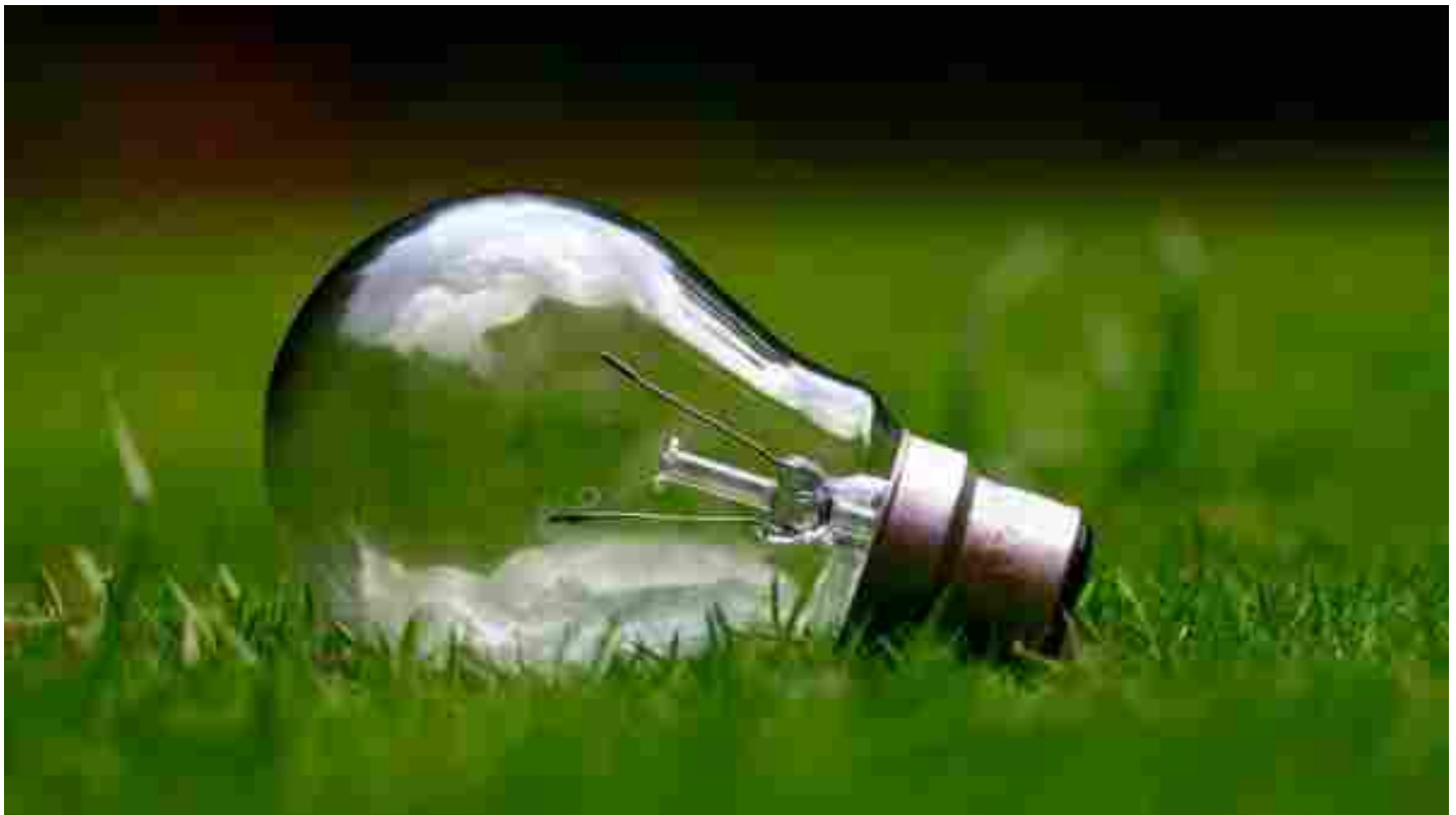
Lampadina (foto di archivio)

D iciotto tonnellate di sorgenti luminose recuperate e avviate a riciclo: questi i dati della Liguria nel primo semestre del 2022. In particolare, Genova si conferma la provincia più virtuosa della regione con 9 tonnellate gestite. A seguire Savona (4 tonnellate), Imperia (3 tonnellate) e La Spezia (2 tonnellate). I numeri sono forniti dal Consorzio per il Recupero di Apparecchiature Elettriche ed Elettroniche Ecolamp .